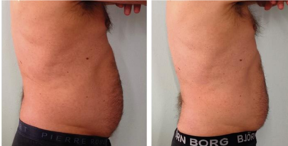
VATSAN SEUDUN HOITO ENNEN JA JÄLKEEN