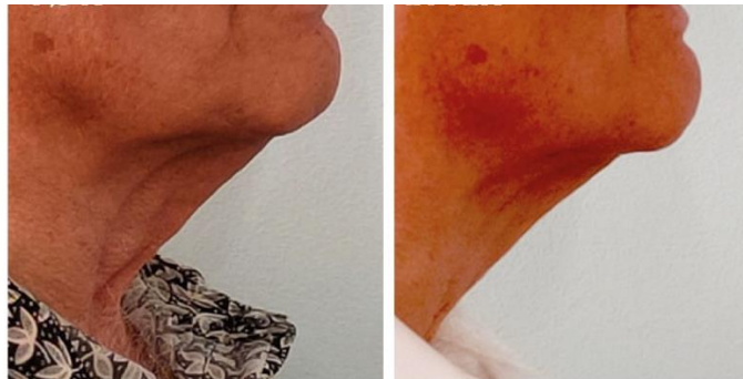
KAULAN JA LEUAN HOITO ENNEN JA JÄLKEEN